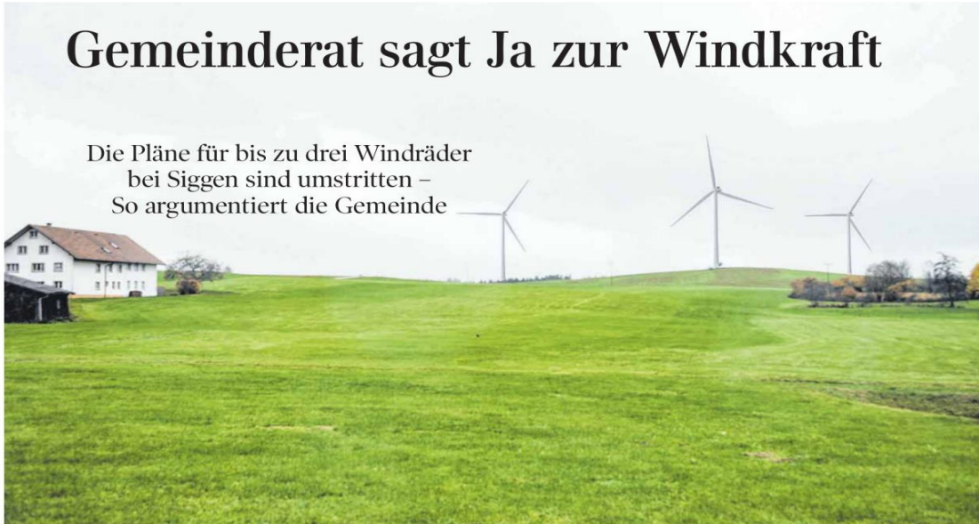
Eine Fotomontage des Projektierers Res Deutschland wurde Ende 2023 bei einer Informationsveranstaltung vorgestellt. Sie zeigt, wie der Blick auf die drei geplanten Windräder von Göttlshofen aus aussehen könnte.

Die Pläne für bis zu drei Windräder bei Siggen sind umstritten – So argumentiert die Gemeinde